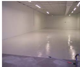
Auto body repair facility/ Atelier carrosserie d'autos